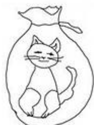
Katze im Sack

Комментарий . Рассмотрите рисунки , подберите к ним фразеологизмы .